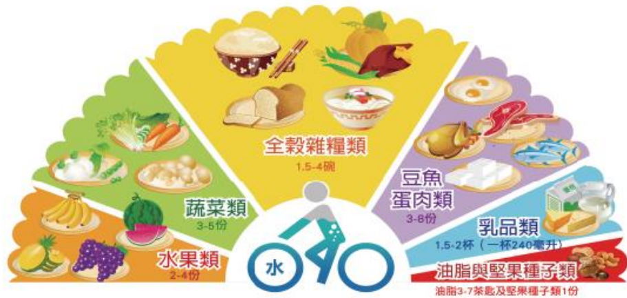
衛生福利部國民健康署「每日飲食指南」