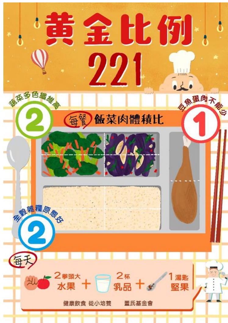
圖 3-3 董氏基金會「黃金比例 221」

註：董氏基金會食品營養專區 黃金比例 221 (2018)。 ( https://www.nutri.jtf.org.tw/Article/Info/3563 )